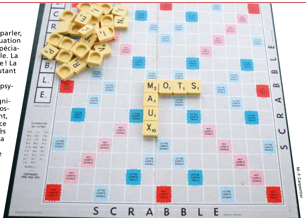
Les mots sont souvent à l'origine de bien des maux.

Pouvoir proposer des chemins de traverse est une porte qui aide le jeune à sortir de l'impasse dans laquelle on le met. Les mots sont souvent à l'origine de bien des maux qui crient dans le corps humain parce qu'ils ont réveillé des restes de paroles anciennes chez