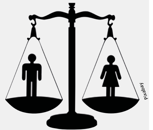
La parole est le premier lien avec l'autre.

Les récentes découvertes en psychologie ont largement démontré toute l'importance pour une victime – souvent faible et apeurée devant son agresseur – de pouvoir dire ses souffrances et l'effet bénéfique de la sentence qui la reconnaît « victime » et lui redonne sa dignité de personne.