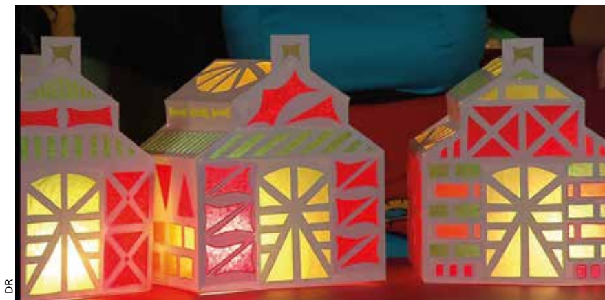
Bricolé spécialement pour les fêtes de fin d'année à base de carton et de minuscules ampoules, le fanal est cher au cœur des Haïtiens.