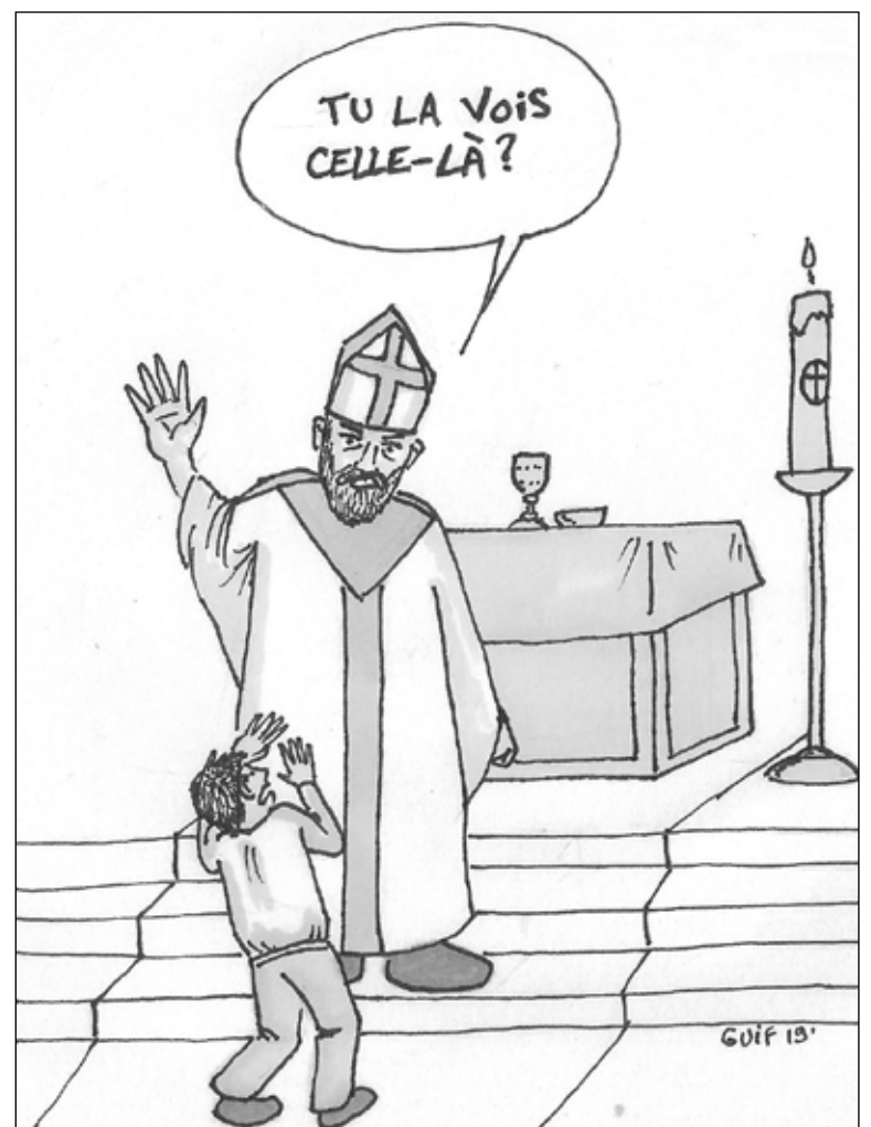
Autrefois, l'évêque frappait la joue de celui qu'il confirmait.

On pense que la confirmation vient après la première communion, comme c'est souvent le cas lorsque les sacrements