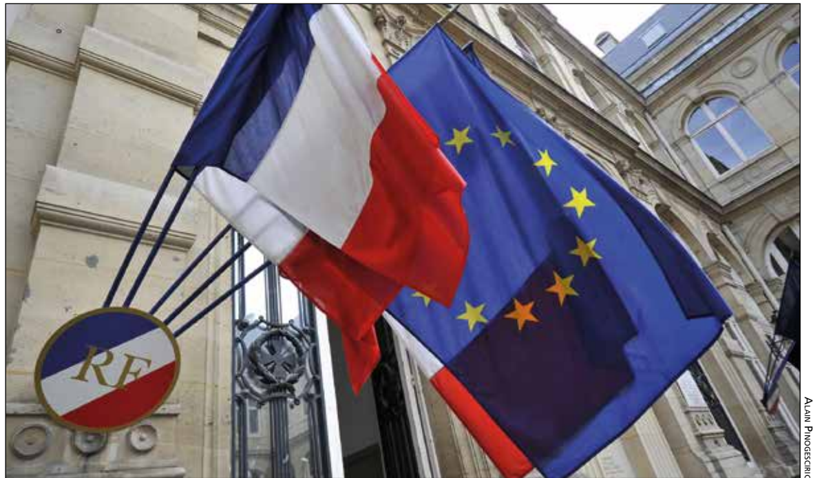
En France, les élections européennes auront lieu le 26 mai.

L'Europe est certes un don des dieux ! Elle est surtout ce qu'en font les hommes. Vaudrait-il la peine de s'engager pour lui donner meilleur contour ? Quelles valeurs ont constitué l'Europe, quelles sont celles qui pourraient la soutenir ?